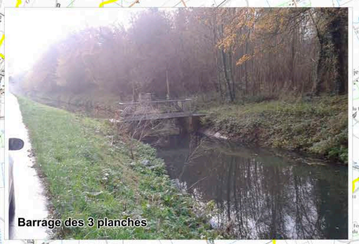
Barrage des 3 planches