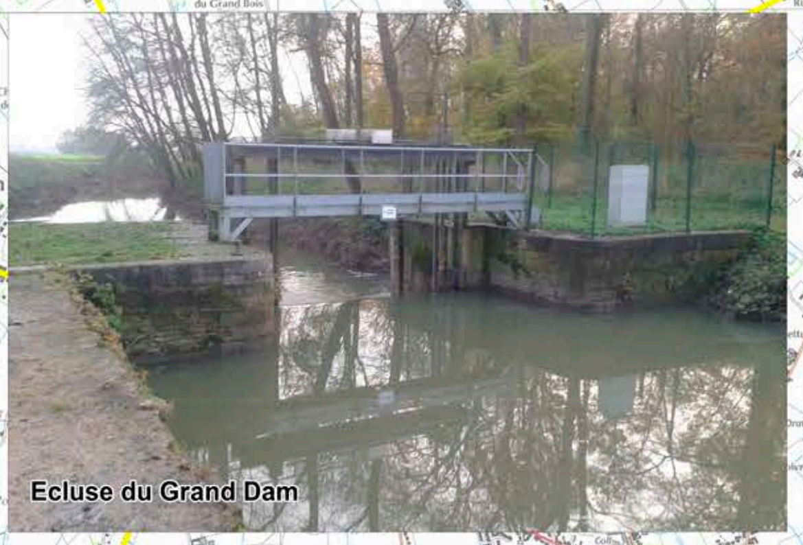
Ecluse du Grand Dam