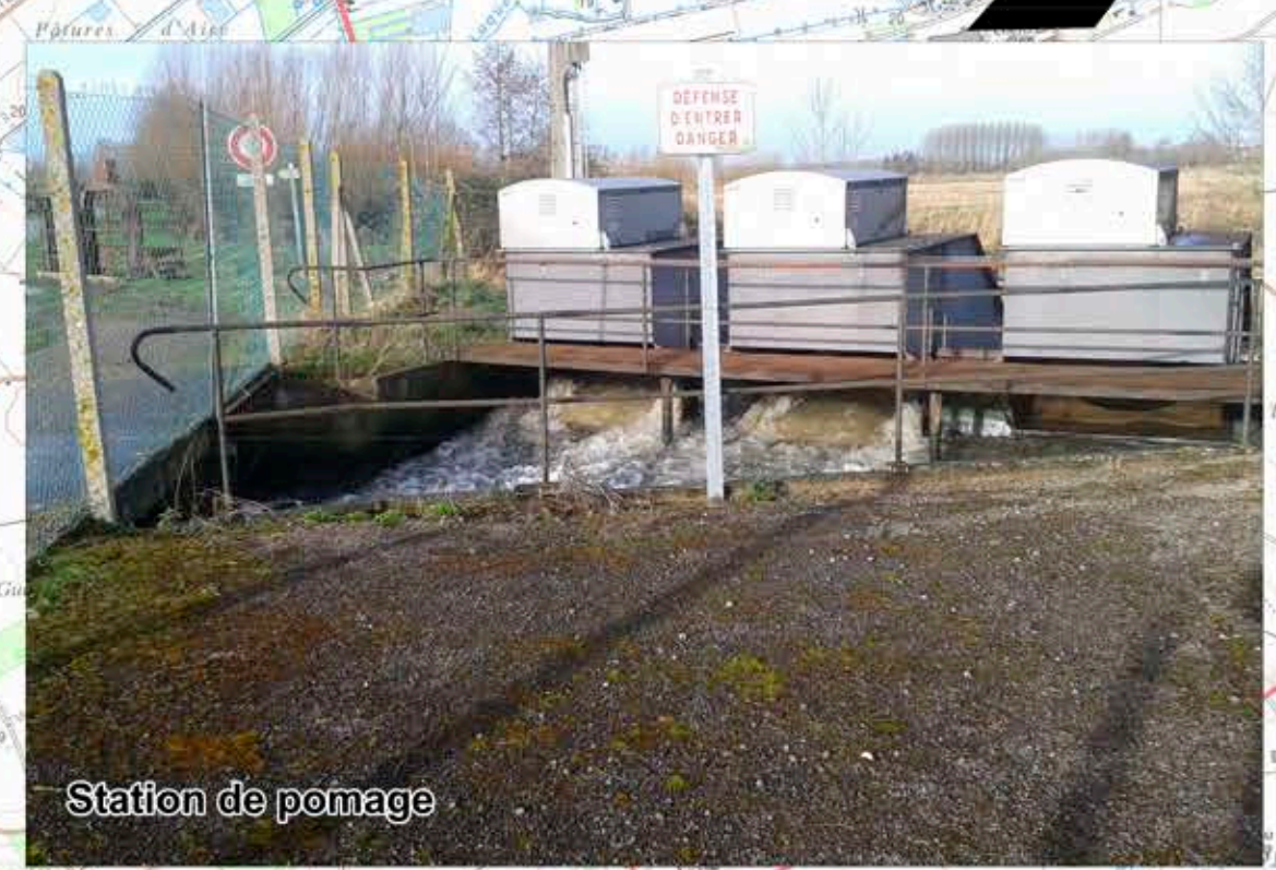
Station de pompage