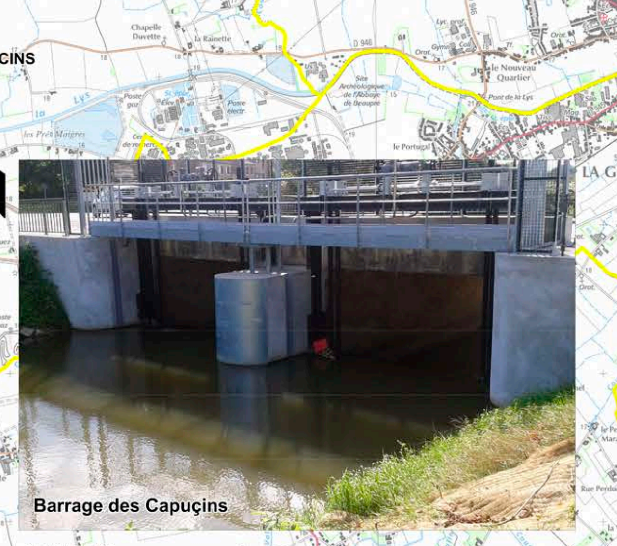
Barrage des Capucins