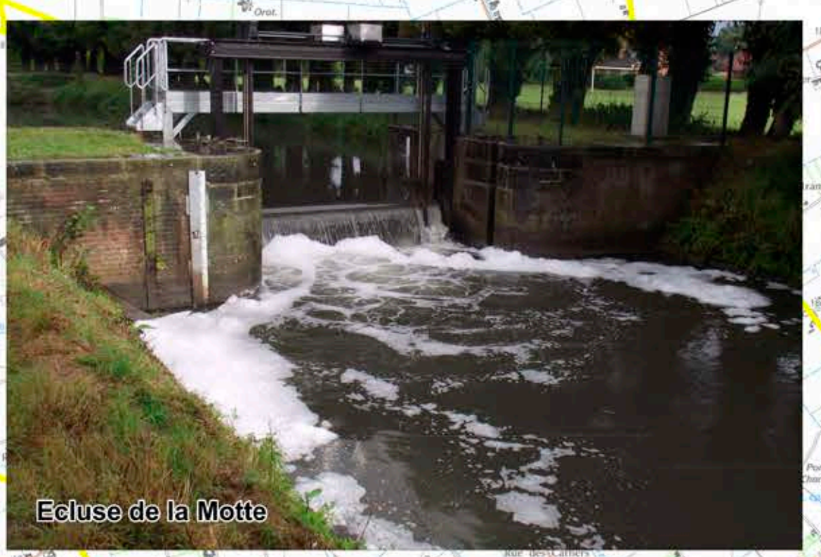
Ecluse de la Motte