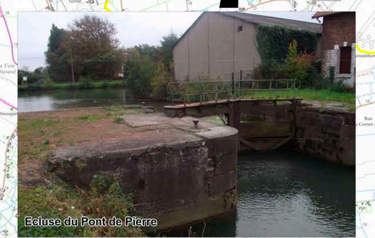
Ecluse du Pont de Pierre