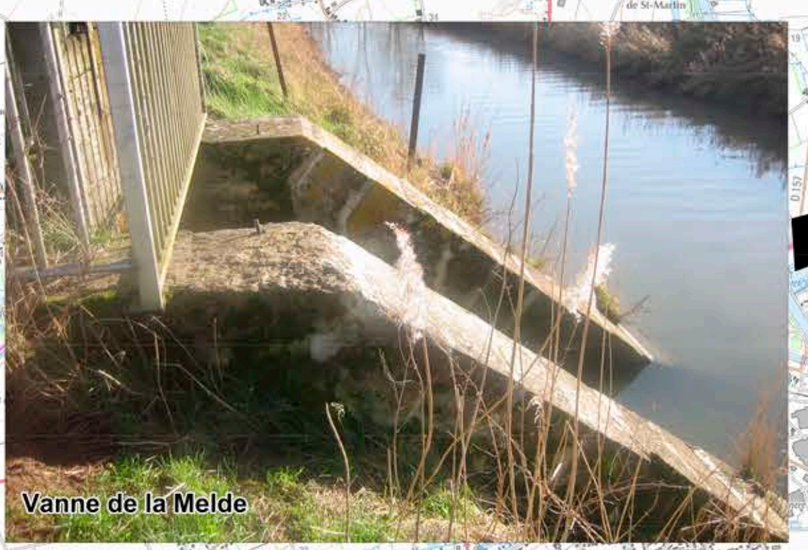
Vanne de la Melde