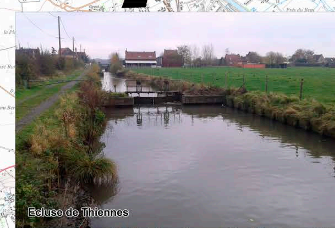
Ecluse de Thiennes